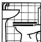
Produit pour l'entretien des sanitaires