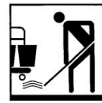
Produit pour le nettoyage manuel des sols