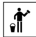
Produit pour le nettoyage des murs et surfaces